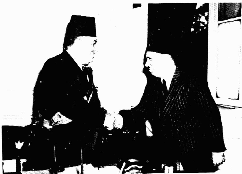
رئيس مجلس الدولة المصري الأستاذ عبد الرزاق السنهوري يستقبل مؤلف الكتاب بمكتبه.